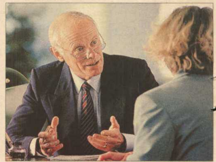
Formación y herramientas de marketing son los ejes del programa.

Ambos desvelaron ayer algunas de sus claves: "Crear lo